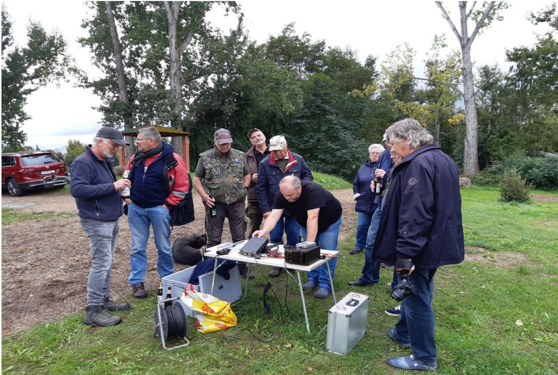
Na ob die Anpassung stimmt? Alles OK – 2S-Stufen bei der Gegenstelle weniger als mit einem Dipol. Dafür im Empfang ruhiger, kein QRN.